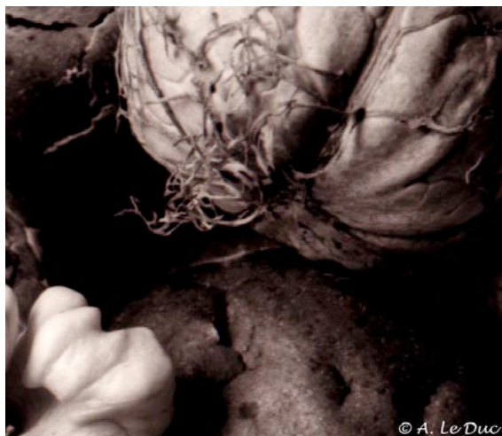
Figure 9: Extrait de la figure 8.