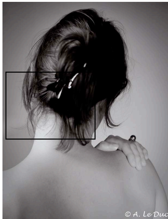
Figure 6 : Exemple de photographie réalisée avec la Rollei Retro 80S (exposée à ISO 50) et développée dans du RLS. Le cadre noir correspond à la zone agrandie en figure 7.