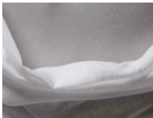
Figure 3 : Extrait de la figure 2 (cadre noir).