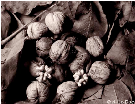
Figure 8 : Exemple de photographie réalisée avec la Rollei Retro 80S (exposée à ISO 80) et développée dans du PMK. Le cadre blanc correspond à la zone agrandie en figure 9.