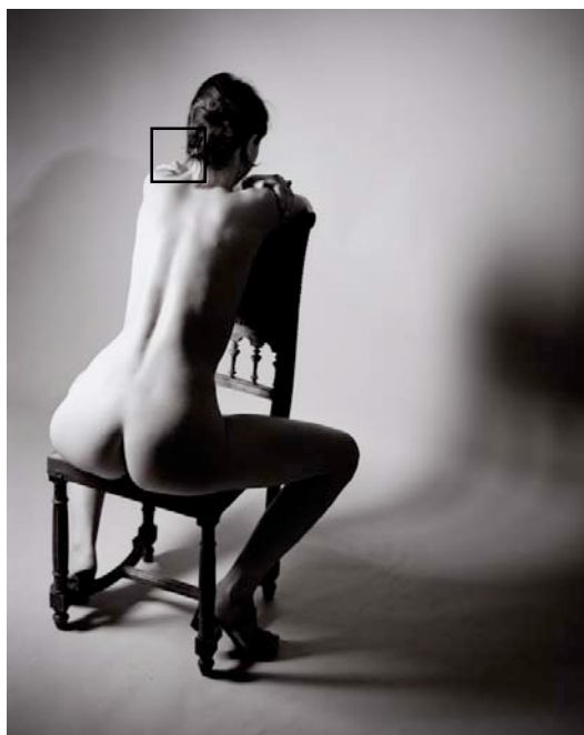
Figure 4 : Exemple de photographie réalisée avec la Rollei Retro 80S (exposée à ISO 50) et développée dans du RLS. Le cadre noir correspond à la zone agrandie en figure 5.