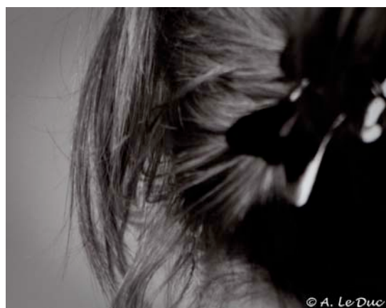
Figure 7: Extrait de la figure 6 (cadre noir).