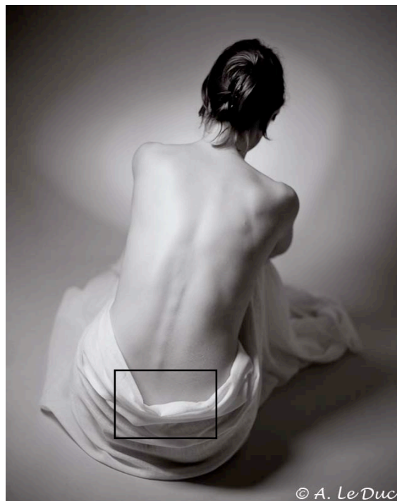
Figure 2 : Exemple de photographie réalisée avec la Rollei Retro 80S (exposée à ISO 25) et développée dans du RLS. Le cadre noir correspond à la zone agrandie en figure 3.

et qui est très similaire au Perceptol de chez Ilford, la vitesse nominale de ISO 80 du film ne peut être atteinte.