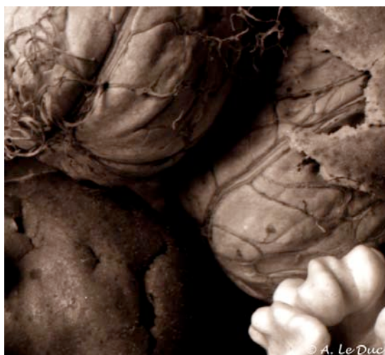
Figure 11: Extrait de la figure 10 .