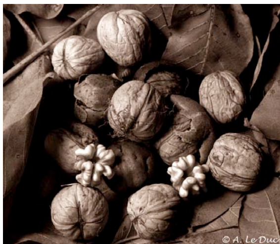
Figure 10 : Exemple de photographie réalisée avec la Rollei Retro 80S (exposée à ISO 160) et développée dans du HC-110. Le cadre blanc correspond à la zone agrandie en figure 11.